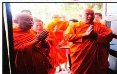
Buddha and Vishnu. a meeting was held in which the decision was taken. In After this inaugural work,

After that the chief guests were welcomed with garlands and flower bouquets. In this meeting, the Niranjana River has been described of