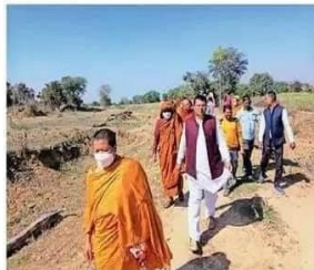
दुर्भरिया के छकरबंदा की ओर जाने भिक्षु सहित अंदा।