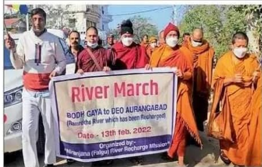
बौद्ध भिक्षुओं ने निकाली रिवर यात्रा।

औरंगाबाद जिले के देव प्रखंड स्थित बूढ़ा-बूढ़ी बांध और राम रेखा नदी को देखा